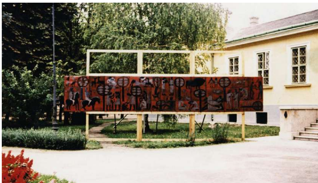
Kátai Mihály: Etruszk fríz, 1963 – A mű a Katona József Múzeum főbejárata előtt látható az 1965-ös kecskeméti zománc történeti kiállításon (zománcozott acéllemez, kb. 1x5,5 m, archív felvétel)