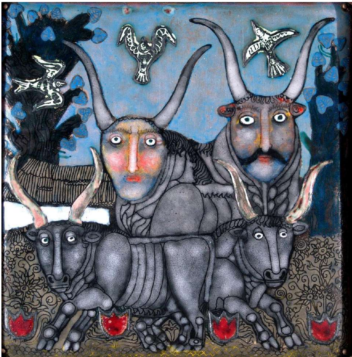
Káta Mihály: Alföldi látomások I., 1981, zománczott vörösréz, 20x20 cm (Nemzetközi Zománcművészeti Alkotóműhely gyűjteménye)