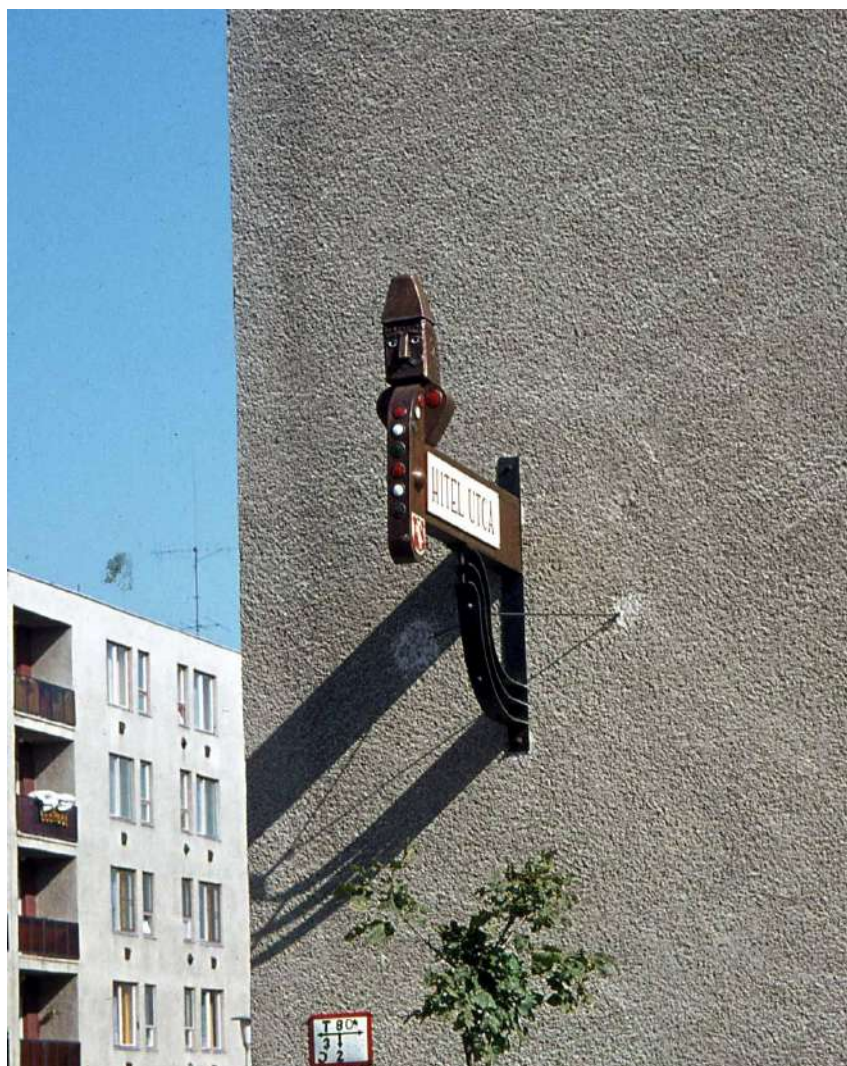
Kátai Mihály: A kecskeméti Hitel utca konzolos névtáblája 1977-ben, a ma már hiányzó kucsmás mellszoborral (fa, zománcozott vörösréz, 78x120 cm, archív felvétel)