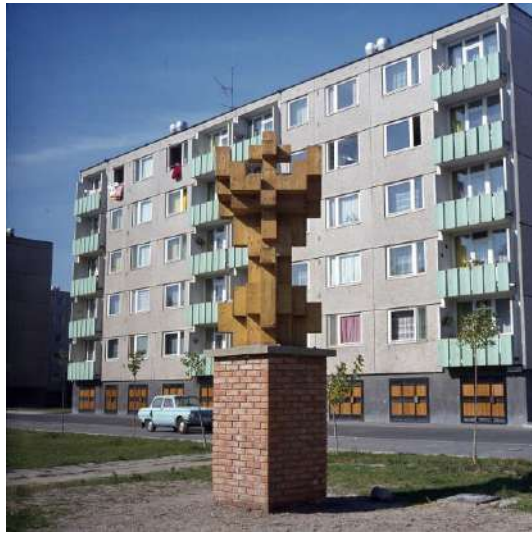
Kátai Mihály Lakótelepi tájékozdó – négy világtáj c. alkotása 1977-ben Kecskeméten a Széchenyivárosban, még zománcborítás nélkül (fa, M: 3,5 m, archív felvétel, fotó: Kiss Béla)