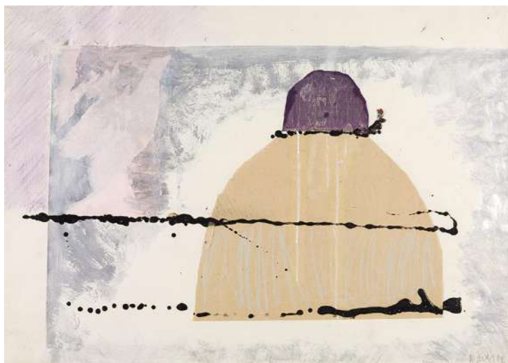
ERDÉLY Miklós (1928–1986): Armageddon , é. n. [1980-81], kollázs, bitumen, ezüstoffesték, karton, 62 x 86 cm