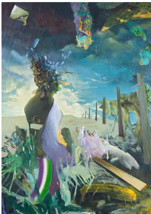
TODOR Tamás (1989): Metafizikus táj , 2014, olaj, vászon, 140 x 110 cm