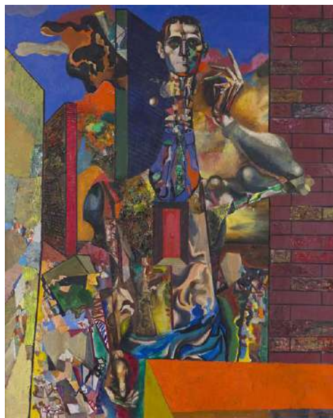
TÓTH László (1933–2009): Önarckép , 1973, olaj, vászon, 155 x 125 cm