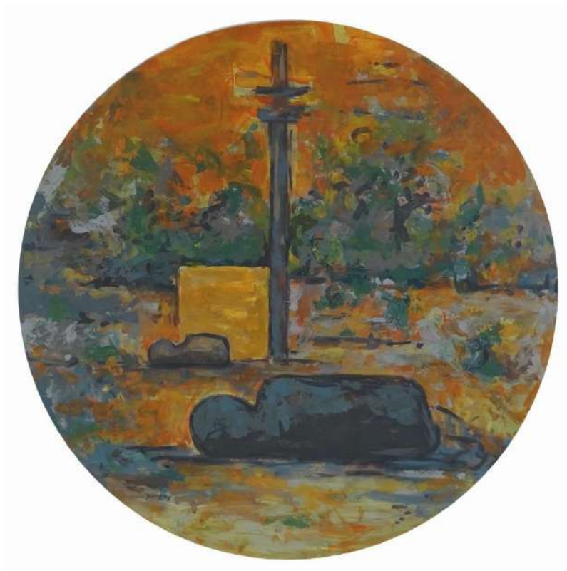
Dimény András: Nyugalom