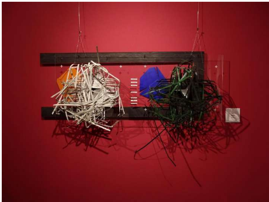
Dimény András: Fészek