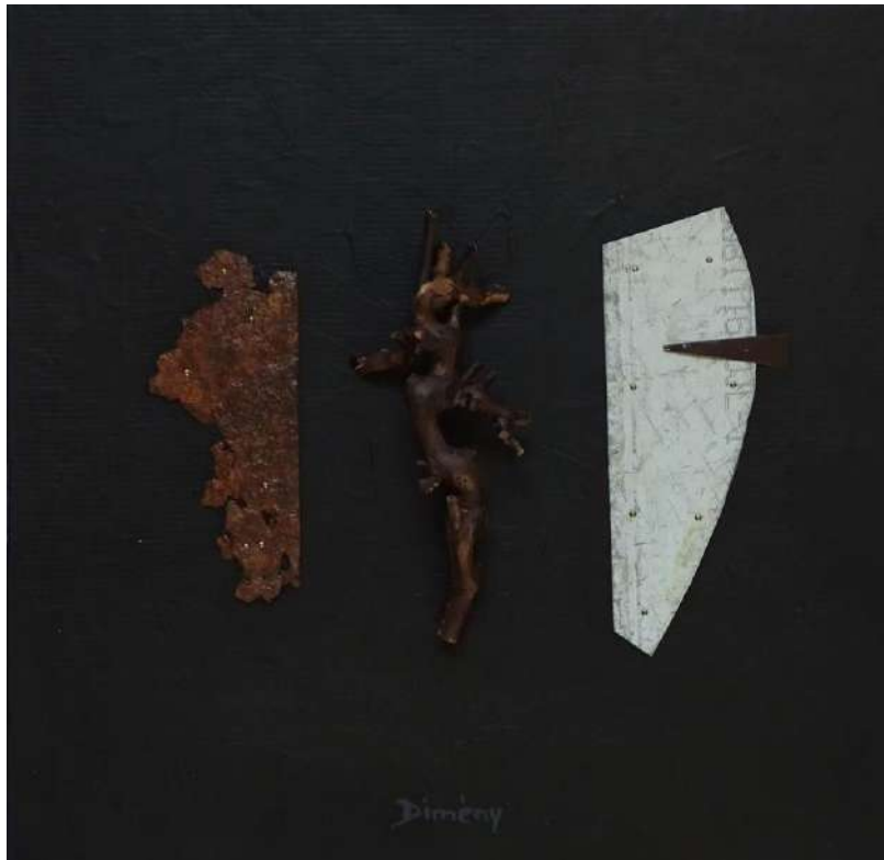
Dimény András: Haiku 2