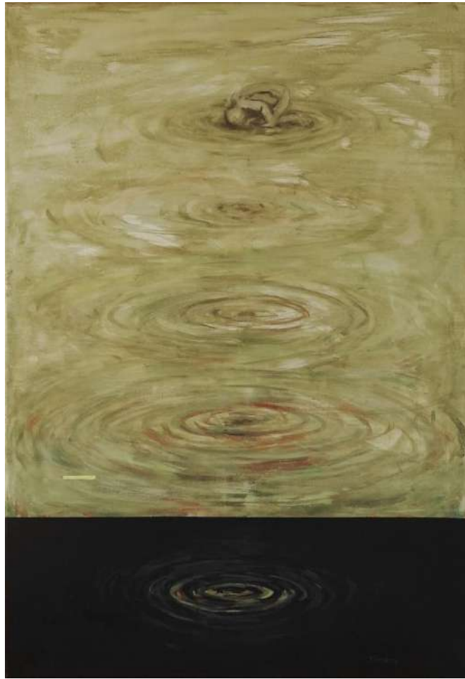
Dimény András: Oldódó jelenlét