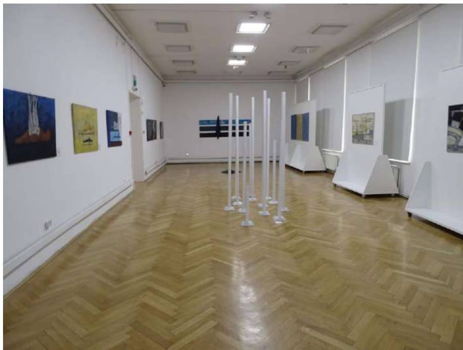
Részlet a kiállításról