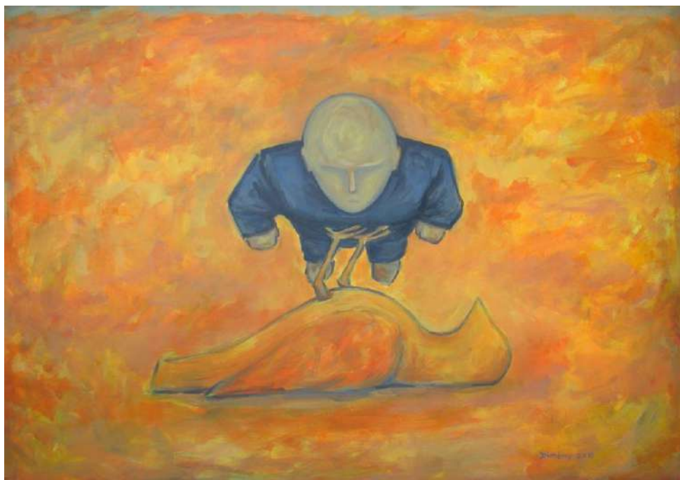
Dimény András: Ecce homo 2