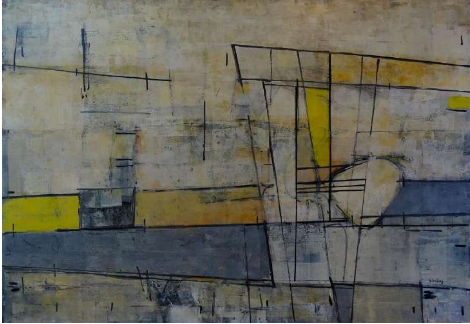
Dimény András: Geometria