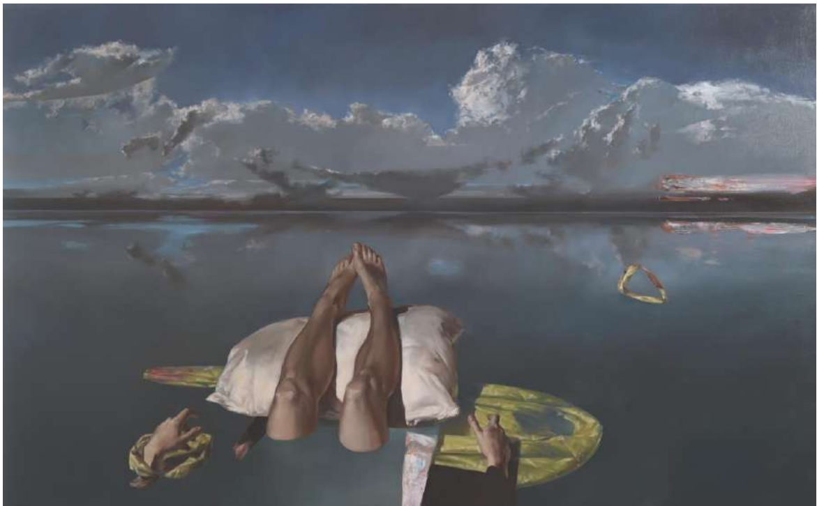
Incze Mózes: Valahol máshol, 2021, olaj, vászon, 120 x 200 cm.