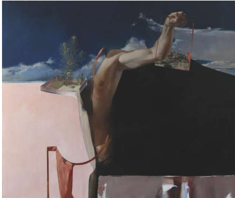
Incze Mózes: Kertész, 2020, olaj, vászon, 100 x 120 cm