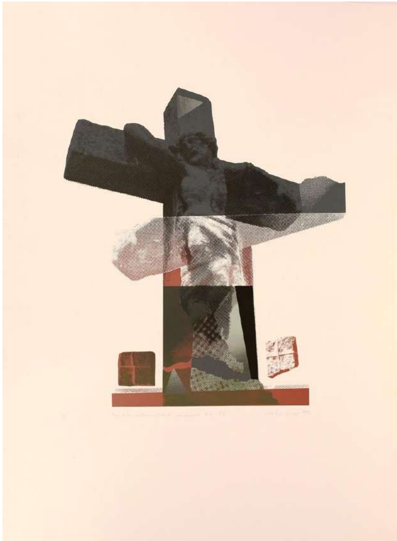
Balanyi Károly: Egy lator metamorfózisa III., 1993, papír, szerigráfia, 67,5x50 cm

A Kecskeméti Katona József Múzeum képzőművészeti gyűjteménye Magyarország egyik legnagyobb, legrangosabb műtárgygyűjtése, mely kategóriájában – 19–20. századi, illetve a mindenkori kortárs magyar képző- és iparművészet – dobogós helyen található. Ennek legújabb része az immár tíz alkalommal megrendezett Kortárs Keresztény Ikonográfiai Biennáléhoz kapcsolódik. 2000 óta ugyanis sikerült létrehoznunk a képzőművészeti gyűjteményen belül egy – a nem egyházi fenntartású magyarországi múzeumokban ma még egyedülállónak tekinthető – speciális gyűjteményi egységet, mely napjaink képző- és iparművészetén belül a keresztény tematikát részesíti előnyben. Ebből a – jelenleg több mint félezer tételt számláló – részkollekcióból 2005 és 2020 között országszerte már 15 kiállítás (pl. Budapest, Szent István Bazilika; Klebelsberg Kultúrkúria; Pécs, Pécsi Galéria; Szentes, Koszta József Múzeum), rendeztünk, melyeken egy-egy válogatást mutattunk be, így élővé téve ezt a múzeumi tárgyegyűttest. A legnagyobb sikert hozó tárlatunk, melyet hat hét alatt 59.892-en tekintettek meg, 2019 nyarán, a Tihanyi Bencés Apátságban volt. (A gyűjteményről bővebben itt lehet olvasni.)