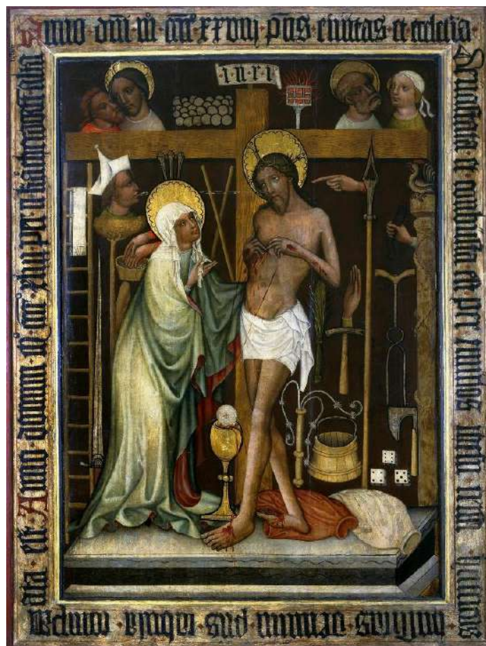
Fogadalmi kép a lengyelországi Brzezből (Arma Christi, Schmerzensmann, 1443, Varsói Nemzeti Múzeum)