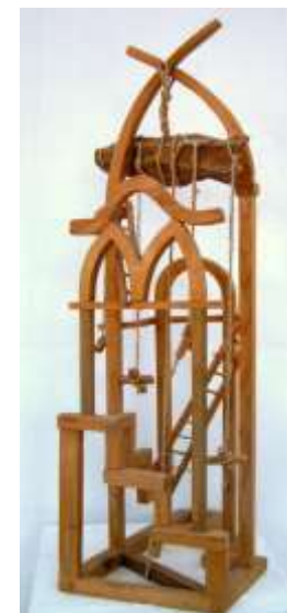
B. LABORCZ FLÓRA