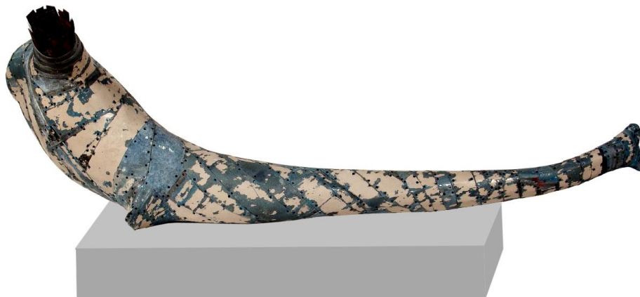
Sejben Lajos: Aki a bárkából kimaradt..., 2020

Ifj. Gyergyádesz László idézőjelben (például riport formában is) felhasználható írása a biennáléről, az előzményekről és a kapcsolódó gyűjteményről