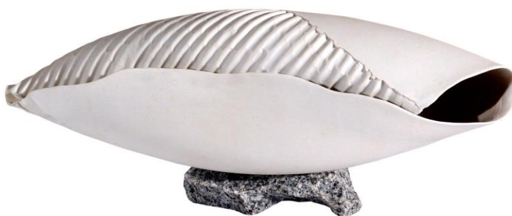
Borza Teréz: A jó földbe vetett MAG, 2021

A kétevente változó tematikus felhívásunk nyomán ezúttal állatokkal és növényekkel kapcsolatos ábrázolásokat tárunk a nagyközönség elé. Csak a Bibliában 121 állatfajról és 80 (míg mások szerint megközelítőleg kétszázféle) növényről olvashatunk, s nem csupán a teremtésükről, vagy éppen a megmentésükről az özönvíz története (Noé bárkája) kapcsán, hanem gyakran szerepelnek hasonlatokban, példabeszédekben is.