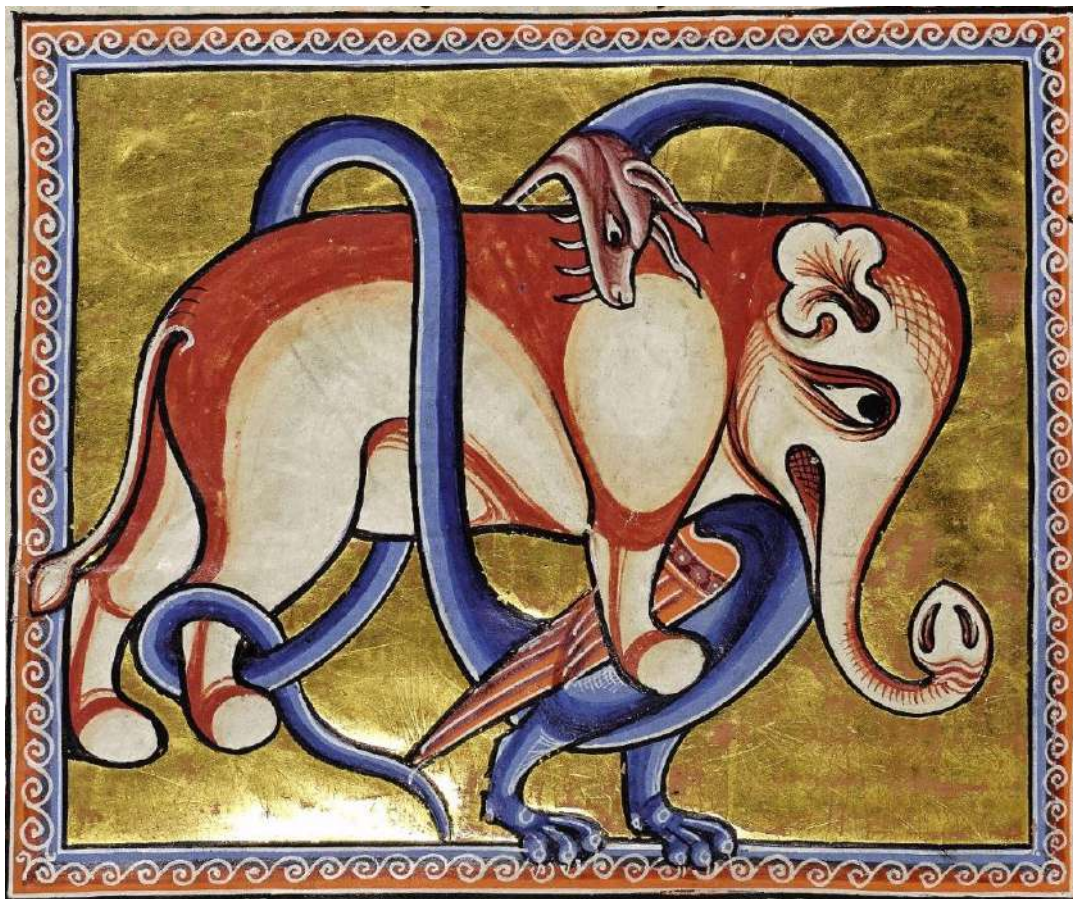
A sárkány megfojt egy elefántot, 13. század eleje (The Aberdeen Bestiary, Aberdeen University Library, Univ Lib. MS 24)