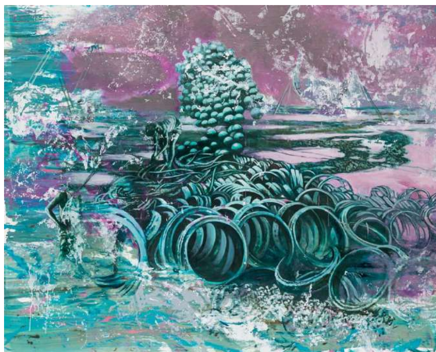
Szász Sándor: Illúzió horizontjának követése , 2018, olaj, vászon, 160 x 200 cm