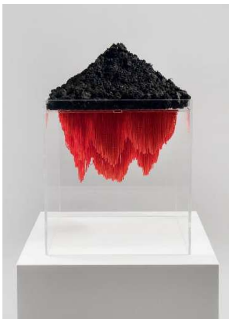
Kovács Kinga: Background , 2021, vegyes technika, 45 x 30 x 30 cm