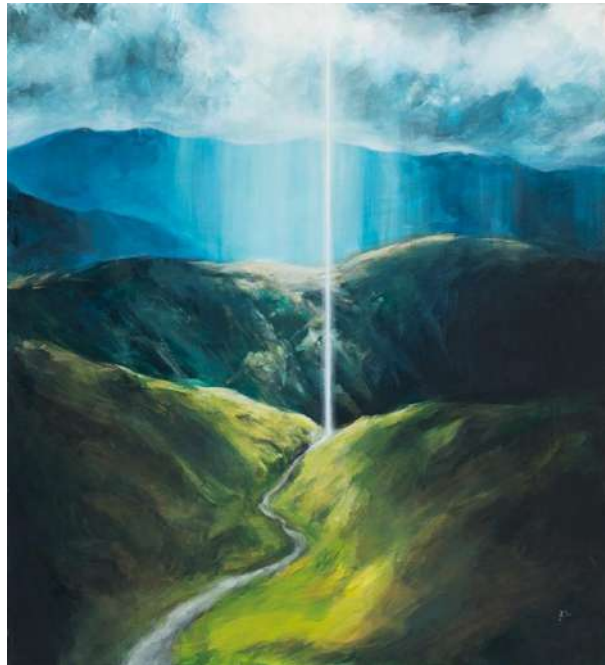
Căbuz Andrea: Akasha III. per 6 , 2023, akril, vászon, 110 x 100 cm