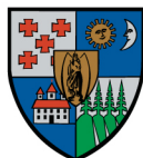
Hargita Megye Tanácsa