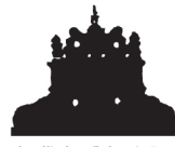
Kulturális és Művészeti Központ Gyergyószárhegy