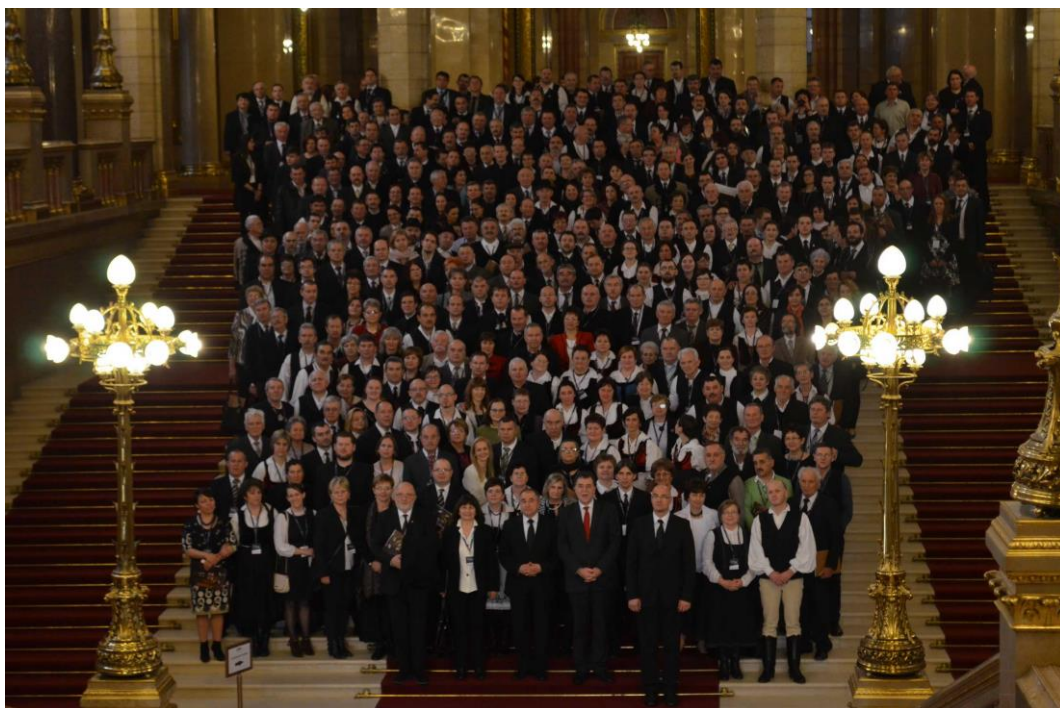
Csoportkép az Országházban