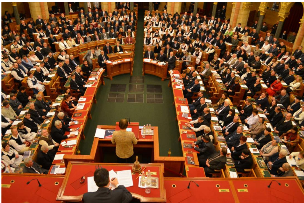
Konferencia az Országházban